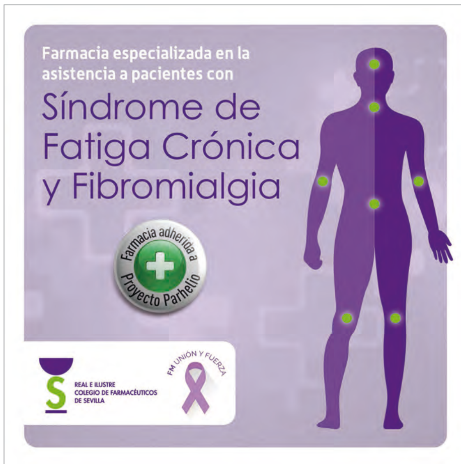
Distintivo que lucirán las farmacias adscritas al Proyecto Parhelio sobre FM y SFT.

En este caso la entidad colaboradora es la Asociación FM Unión y Fuerza, que compartirá su experiencia y necesidades con el Colegio con el fin de que se pueda ofrecer formación específica sobre farmacoterapia y fisiopatología de esas enfermedades a los farmacéuticos interesados para que puedan llevar a cabo una supervisión, control y educación más completa de la misma a las personas afectadas.