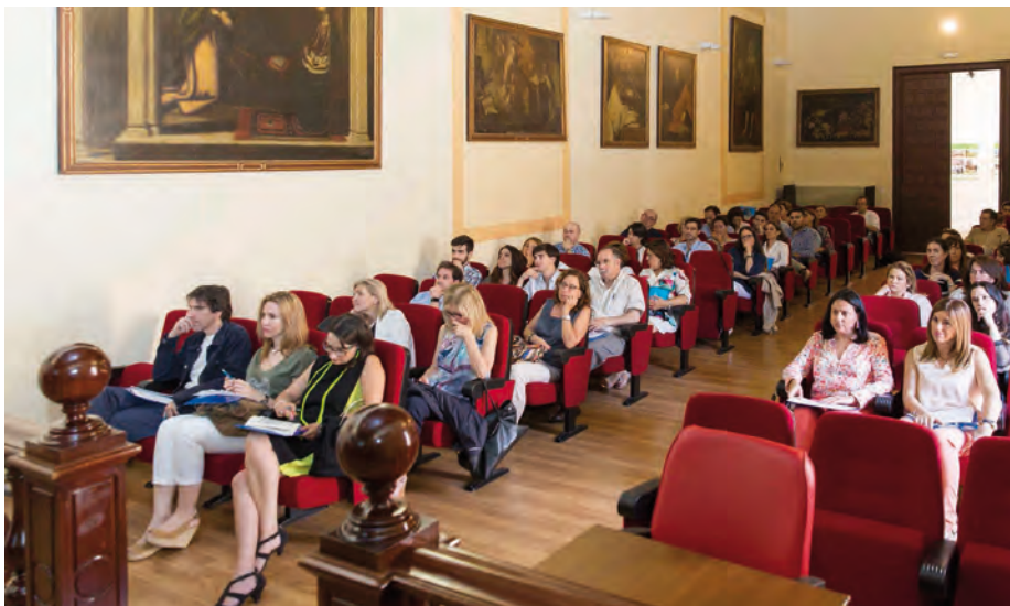
Aspecto de la sala durante las Jornadas de Atención Primaria.

Aparte de servir para estrechar vínculos profesionales, estas jornadas han contado con una programación científica especialmente centrada en medidas para favorecer la adherencia y la seguridad terapéutica