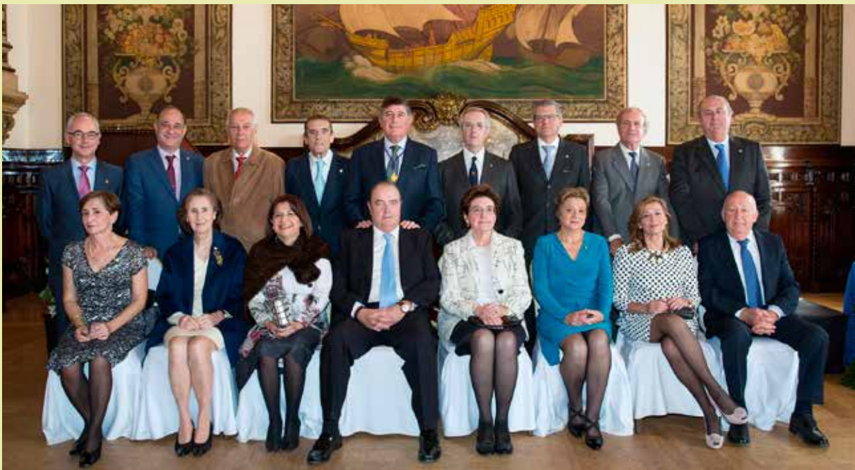
Compañeros con 40 años de colegiación que recogieron su Insignia de Oro, junto al Presidente del Colegio.

Los compañeros que han cumplido los 40 y 25 años de colegiación respectivamente recibieron las insignias de Oro y Plata de la Corporación.