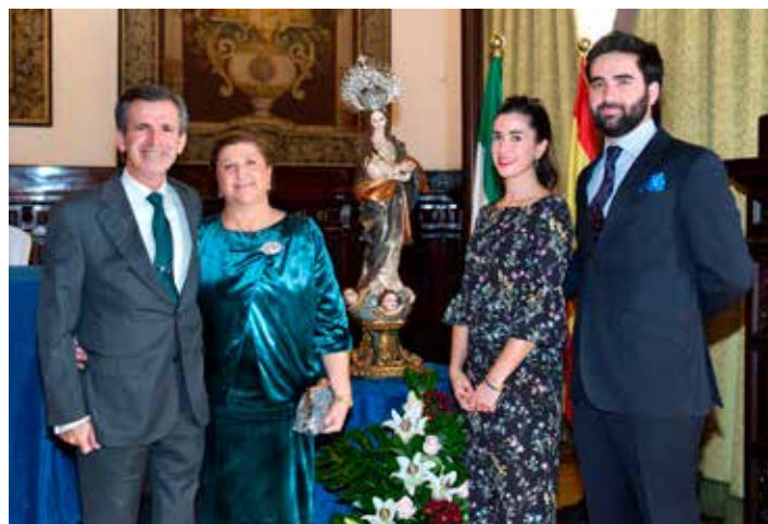
La pregonera, con su familia.