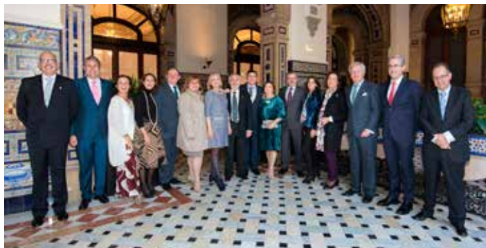
La pregonera con los miembros de la Junta de Gobierno del Colegio.

Como cada año, tras el Pregón, tuvo lugar un cóctel y el tradicional almuerzo de confraternidad, donde pudimos compartir con los compañeros momentos muy agradables.