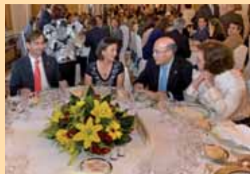
El Presidente del Colegio de Huelva y su esposa, con el Decano de Farmacia y su esposa.