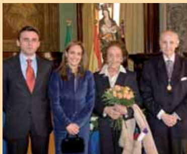
La Presidenta de los Colegios manchegos junto a su esposo y Santiago Grisolia y su esposa.