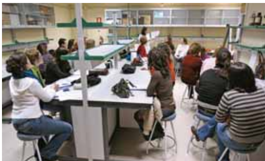
Un momento de la sesión práctica en los Talleres sobre formulación.