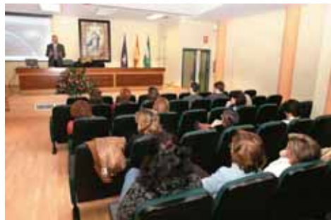
Aspecto del Salón de Actos durante una sesión formativa sobre Receta Electrónica.

Durante los meses de diciembre y enero se han estado realizando en el Colegio sesiones formativas, eminentemente prácticas, sobre Receta XXI, orientadas al manejo de la herramienta informática, Internet, etc..., así como a la solución de dudas sobre sustituciones, caídas del sistema, etc... y posibilidades que brinda la Intranet. En total, han pasado ya por el Colegio unos 150 Colegiados. Las sesiones han concluido a primeros de febrero y se reanudarán en primavera. ■