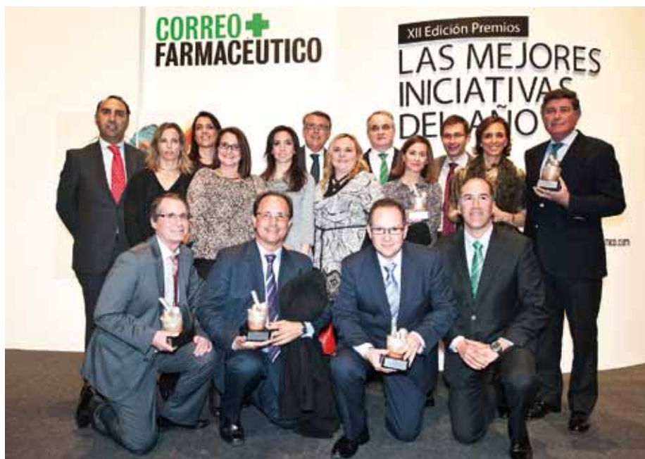
Foto de Grupo de la representación andaluza que logró distinciones: los colegios de Sevilla, Cádiz y Huelva y el Consejo Andaluz.

para el Colegio de Huelva, por su proyecto de Conciliación de la Medicación; y para el Consejo Andaluz por el Proyecto MAPAfar-